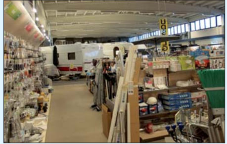
Et kig ud over udstillingshallen

Velkommen til en kop kaffe samt en professionel køkken og camping snak!