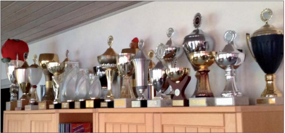
Her et glimt af de pokaler jeg har kørt hjem gennem årene.

tes og hvad gør man så. Der er ingen der vil modtage en campingvogn til skrot, uden det koster en herregård, Vi brugte i stedet en weekend på at skille campingvognen ad og sortere den i forskellige bunker. Så koster det kun lidt at komme af med den. Se billeder hvordan det kan gøres.