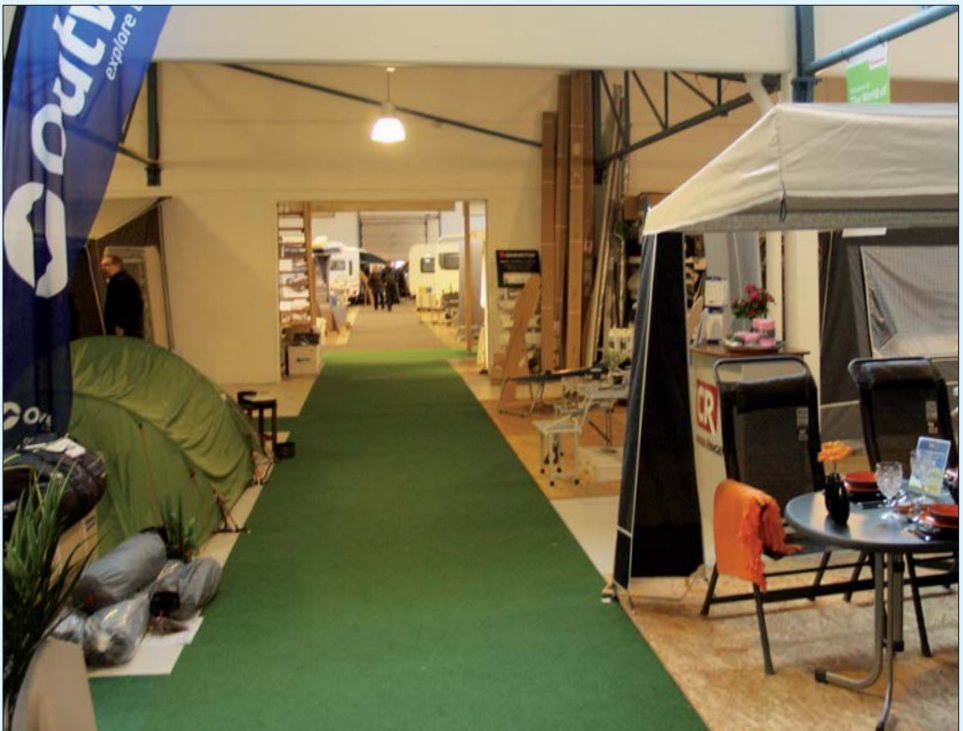
Slagelse camping og outdoor center har rigtig mange kvadratmeter under tag. Det giver gode muligheder for uanset vejret at se på de mange produkter - også i teltafdelingen.