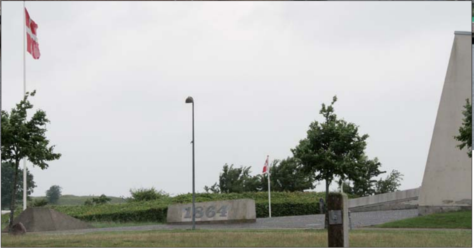
Der er mange seværdigheder i og omkring Sønderborg, f.eks. ved mindesmærket for slaget i 1864 og voldgravene ved Dybbøl udenfor Sønderborg.