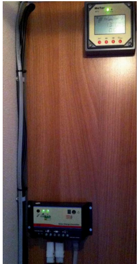
Her følges produktionen af strøm og forbruget.