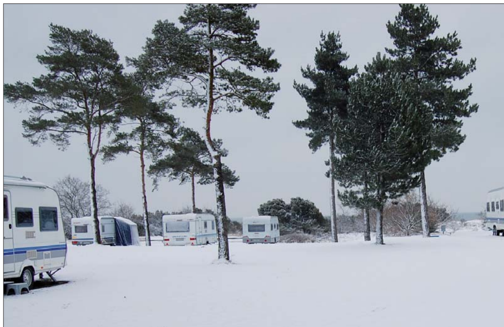
Feddet Caming

“Vintercamping er charmerende, men vognen skal være klar til at modstå frost. Det indebærer fx at smøre støtteben og næsehjul, så det ikke fryser fast, og frostsikre vandantæppet. Det er også en god ide at kontrollere varmeanlægget, og 3-4 dage inden