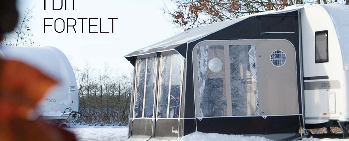
UNIVERSAL 420 COAL

Kender du følelsen af frihed og den komplette ro i det snedækkede vinterlandskab? Med fortelte og tilbehør fra Isabella kan du campere hele året rundt. Besøg vores hjemmeside www.isabella.net eller din nærmeste forhandler og bliv inspireret af det brede sortiment indenfor fortelte og tilbehør til både efterår og vinteren.