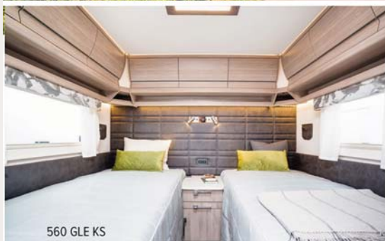
560 GLE KS