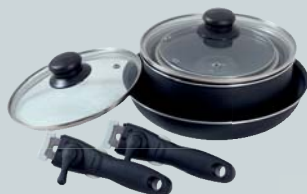
STABELBART GRYDE- OG PANDESÆT

Gå aldrig ned på køkkenudstyr – heller ikke på campingferien!