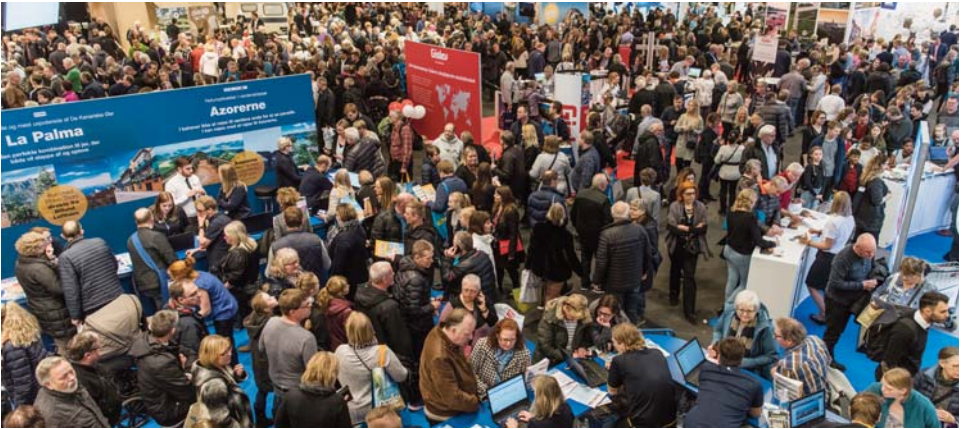
Masser af rejslystne på "Ferie for alle" i 2018. Spændende at se om der bliver trængsel igen i Fredericia.