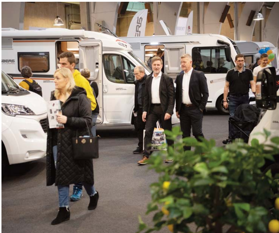
Camping fylder fortsat meget på Ferie for Alle, hvor der traditionen tro også er mulighed for vintercamping.

Skandinaviens største feriemesse, Ferie for Alle, finder sted i MCH Messecenter Herning i slutningen af februar og lancerer i år to nye områder, der begge favner tidens fokus på oplevelser i det fri.