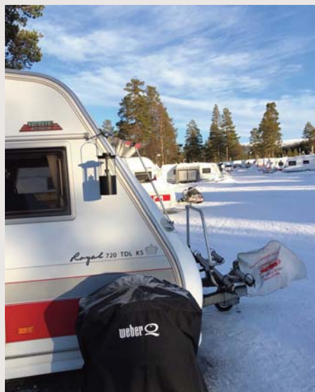
Soludsigt fra CC Camping Tandådalen, Sverige.