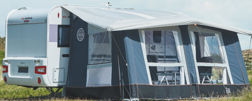
Isabella AIR CIRRUS NORTH 400

Med Isabella AIR går vi ikke på kompromis med materialerne. Vi bruger udelukkende de samme velkendte Isabella materialer, som vi bruger i vores traditionelle Isabella fortelte. Teltet er fra forarbejdning af stof til det færdigsyede telt, fremstillet i Europa.