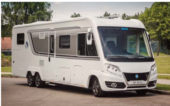
Knaus Sun I liner

lokale forhandler, og udvalget af vogne er i år endnu større end sidste år. Specielt er der satset stort på Südwind Silver Selection serien, som uden tvivl vil trække meget opmærksomhed. Den er af flere blevet kaldt den flotteste Südwind nogensinde, og den rammer plet med både pris og udstyr. Kik blandt andet forbi Südwind Silver Selection 580 QS