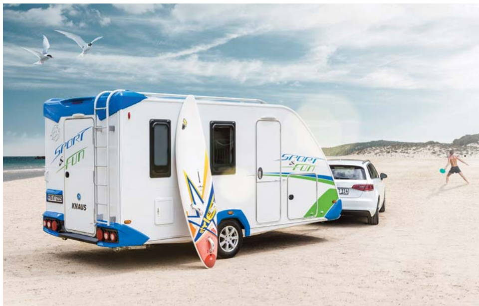
Knaus Sport & Fun

Messesæsonen står for døren, og Knaus har i år stande på samtlige af de tre danske messer, som i weekenden skydes i gang med Ferie-Fritid 2016 i Odense.