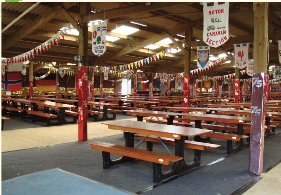
Stille før stormen, her var der liv og glade dage hver aften og mange venskaber blev skab.