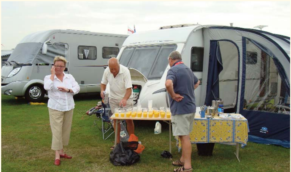
Fra en mindre reception, juice kan forekomme.

par selvvalgte ture. Der skete rigeligt med underholdning på pladsen. Der var gang i den fra morgen til midnat. Ud over den planlagte underholdning, byder arrangørerne fra de enkelte nationale klubber hinanden til reception. Det er spændende, vi mødte en masse rare mennesker og der er rigeligt at tale om. Jeg skal ikke glemme alt det mad og drikke af forskellig slags der tilbydes.