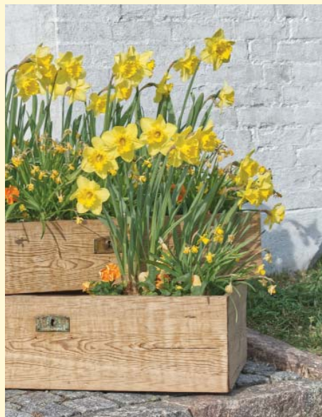
Forside: Flemming Bøgvad