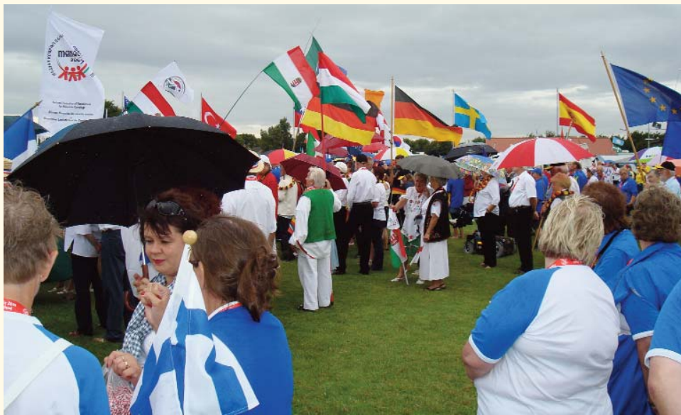
Samling før indmarch.