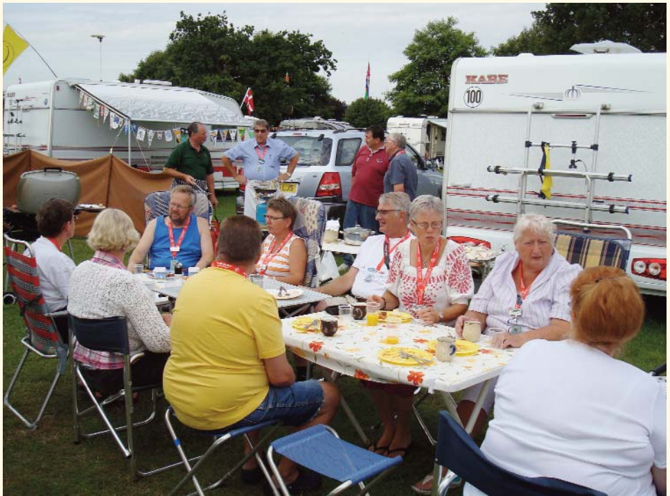
Et sjældent syn :)