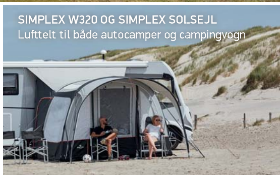
SIMPLEX W320 OG SIMPLEX SOLSEJL Lufttelt til både autocamper og campingvogn