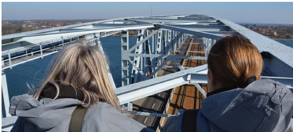
FDM travel lancerer en række kør selv-ferier, der guider rundt til oplevelser og nye sider af Danmark. Foreløbig kan man vælge mellem seks forskellige ture, eksempelvis Lillebælt rundt, men flere er på vej.

Corona har fået danskerne til at holde ferie i Danmark. Derfor udvider Danmarks største udbyder af kør selv-rejser med et nyt koncept for Danmark.