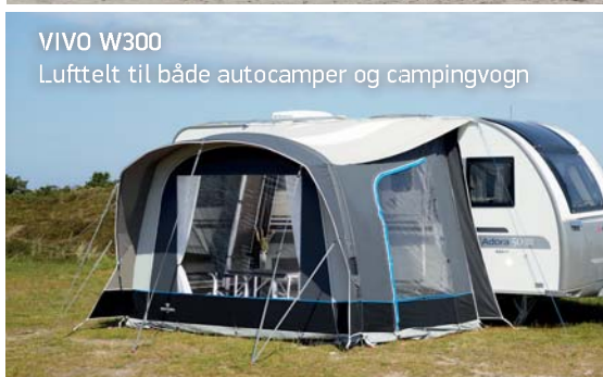
VIVO W300 Lufttelt til både autocamper og campingvogn