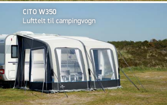
CITO W350 Lufttelt til campingvogn

Ventura Air luftteltene er enkle, elegante og fås til både campingvogne og autocampere.