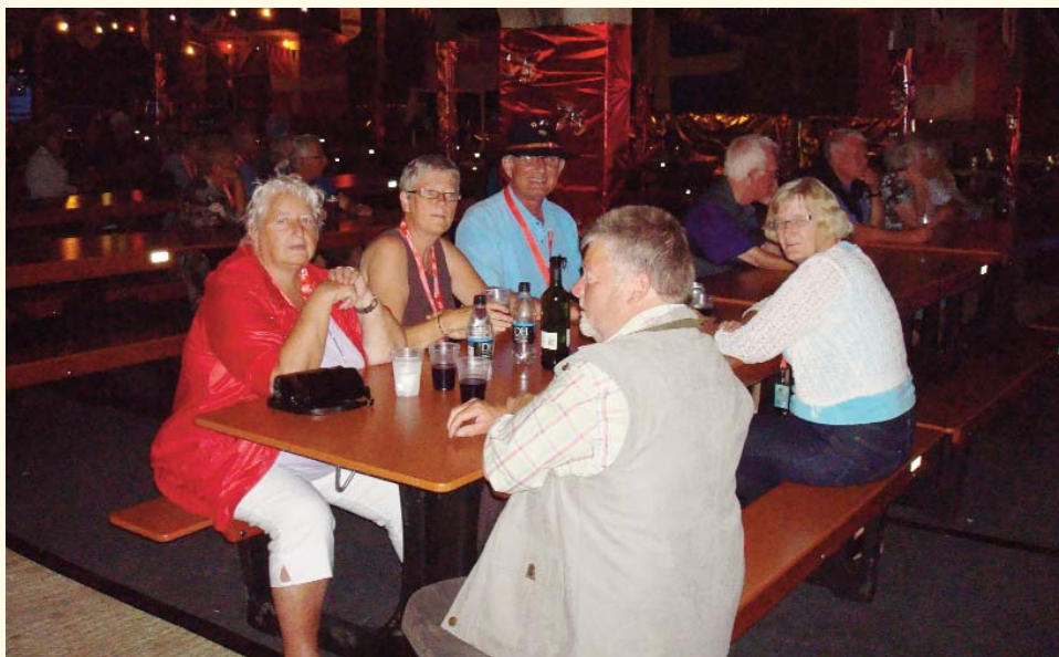
Hygge i danskerlejren.