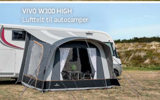
VIVO W300 HIGH Lufttelt til autocamper