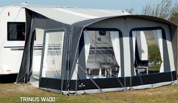
TRINUS W400 Lufttelt til campingvogn

Ventura Air luftteltene er enkle, elegante og fås til både campingvogne og autocampere.