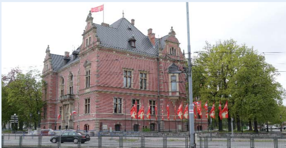
Det var 1. maj og de røde faner vajede overalt. Vi troede, vi skulle opleve en større folkefest, men nej. Det er en helligdag, så derfor var det meste lukket.

Landskassereren meddeler, at han har en budgetmodel, så er der da noget at holde sig til.