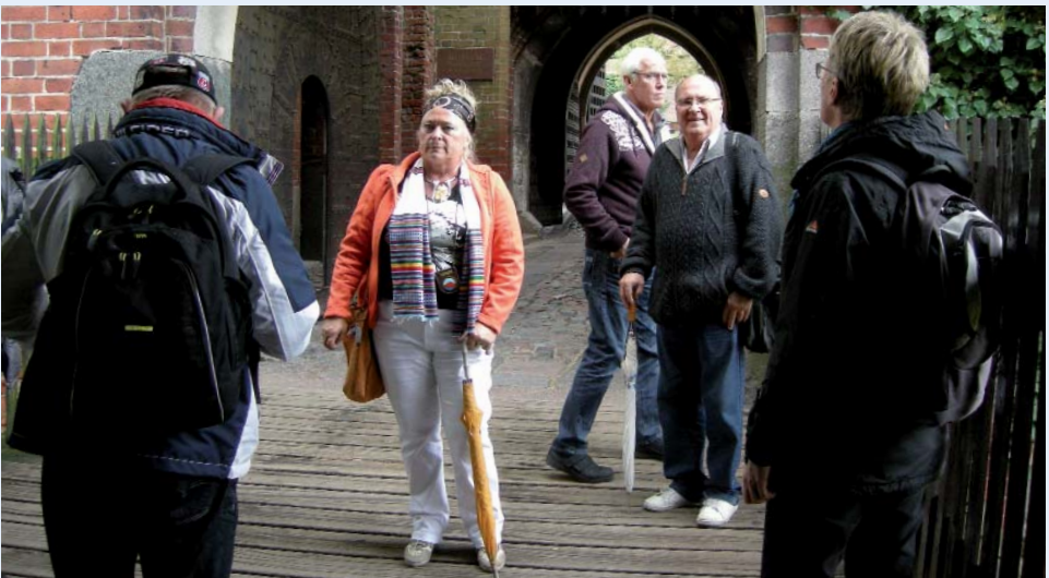
Vores 1. guide på Malbork.

Tirsdag - Det er en fridag og vi vil med bus-sen/sporvognen til Gdansk, for der var flere af de steder guiden havde omtalt, som vi gerne ville se lidt nærmere på. Samme ide