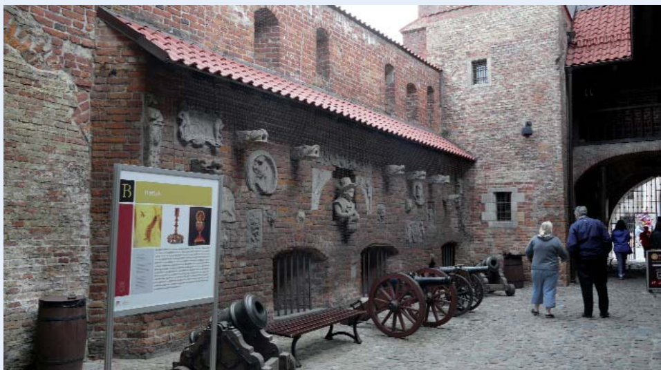
Vi spadserede rundt i Gdansk og kom denne gang til fængselstårnet og igennem fængselsgården.

Nu kontakter vi det polske par, for at få hjælp til at finde priser på vores forskellige ideer og muligheder.