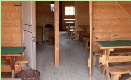
Krig føres også fra skrivebordene, her fra kommandobarakken ved Dybbøl.