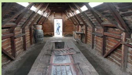
Hvor mange kokke som lavede søle her, vides ikke, men soldaterne havde også brug for mad også for 150 år siden. Og således blev den lavet.