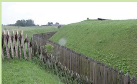
Voldgrave med palisader og spidse ryttere er genskabt ved Dybbøl udenfor Sønderborg.

Og mens vi tager for os af seværdighederne i Sønderborg, må vi ikke glemme den danske kongefamilies sommerresidens, Gråsten slot, hvor haveanlægget er delvis åbent for besøgende. Lige i nærheden ligger Augustenborg slot, hvor det er muligt at sidde under det samme lindetræ, som i sin tid gav