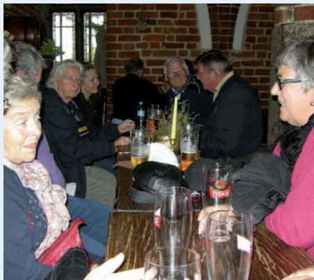
DCK'ere, som af uransagelige veje igen har fundet et sted med udskænkning.

Fredag kl. 11 er der standerstrykning og der bliver uddelt præmier. Vi går i gang med at "hilse af". Det har været et virkeligt godt stævne!!