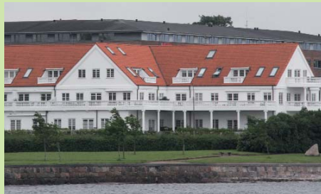
I strandkanten ligger ny opførte luksuriøse boliger på række og rad.