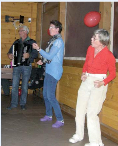
Selv mennesker, der sædvanligvis er stilfærdige, må overgive sig til orkesterets lokkende toner.

Lørdag - Vi er vist kun 4 vogne tilbage sidst på formiddagen og nogle af os sætter igen kursen mod Camping Marina i Szczecin.