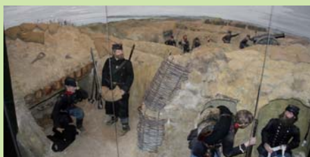
Tableauet viser hvordan slagmarken udartede sig for de danske forsvarere som i 1864 tappert forsøgte at hindre tyskerne i at trænge gennem til selve byen Sønderborg.