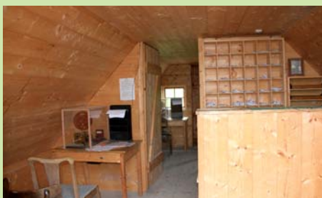
Telegraf og postkontor var datidens kommunikationslinjer, og således så kontorene ud.