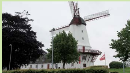
Dybbøl Mølle en lille kilometer udenfor Sønderborg har fire gange været brændt og genopbygget i sin oprindelige form.