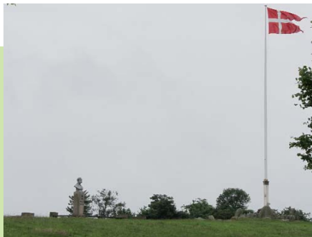
En enormt høj flagstang med Dannebrog blafrende i vinden markerer overfor tyskerne på den anden side af fjorden at dette nu er dansk land.

kan nydes sammen med kaffe eller andre gode sager. Skulle varmen blive påtrængende, er det bare at tage badetøj med på vandringen, for Augustina har sin egen, freddede badeanstalt, som er åben for alle besøgende.