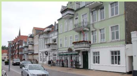
Kanoner med tilhørende ammunitionsvogne er opstillet og vogter de genskabte skanser ved Dybbøl.