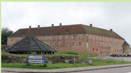
Sønderborg Slot blev i sin tid bygget som fæstning, men er i dag et museum som viser dansk historie og kultur gennem hundredårene.

hele om til museum. Der findes lokalhistoriske samlinger fra middelalderen til i dag med hovedvægt på de slesvigske krige 1848-1850 og 1864. I tillæg viser museet udstillinger om søfart, tekstil, håndværk, og har en mindre kunstsamling med værker af fremtrædende sønderjyske malere gennem tiderne.