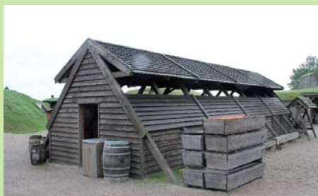
Kisterne er klar udenfor bygningen som kan være et genskabt feltsygehus...