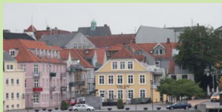
Sønderborg har mange små, hyggelige spisesteder med god menu og overkommelige priser. Det samme gælder også småbutikkerne, men der er priserne mere turisttilpasset.

I Augustina findes en skulpturpark som kombinerer billedkunst og naturoplevelser. På vandringen gennem parken er det muligt at se – og røre ved – det største antal uden-dørs skulpturer som findes samlet et sted i Danmark. I selve Palæet findes malede kunstværker og international grafik, som