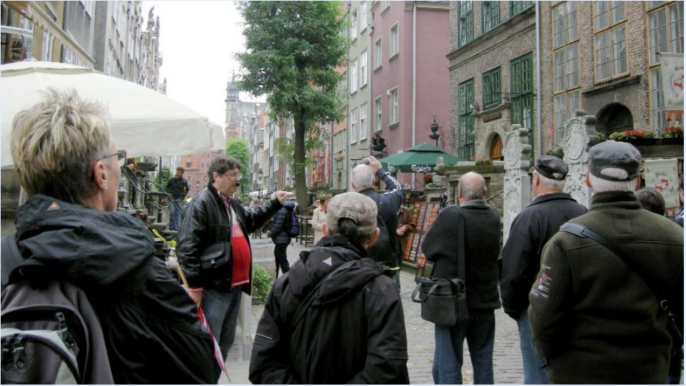
Manden i den røde trøje er vores guide. Han ligner et fuldgældigt medlem af DCK og er derfor stærk til-lidsvækkende.

verdenskrig var også noget hårdere ved Gdansk. På sejlturen fik vi serveret gullasch-suppe og helstegt flynder med traditionelt polsk tilbehør.