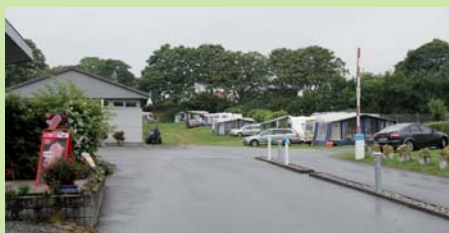
Kollund Camping lidt udenfor Sønderborg er en af de mange og hyggelige campingpladser, som gør at området næsten er som skabt til camping med autocamper eller campingvogn.