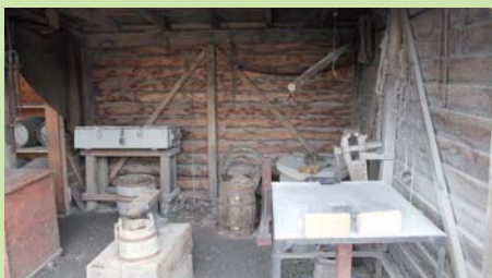
Smede, hovslagere, bagere og andre håndværkere havde alle specialiserede bygninger i datidens militær.