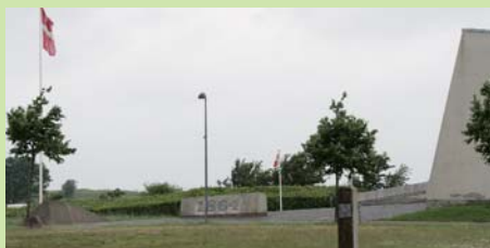
Lige her, ved mindesmærket, gik frontlinjen mellem danskerne og tyskere da slaget i 1864 rasede som værst. I dag er stedet genskabt som et historie center som tager os 150 år tilbage i tiden.