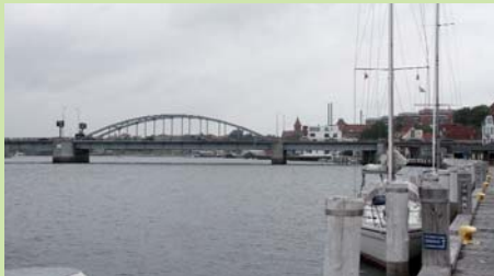
Broerne, og før deres tid færgerne, var oprindeligt de største indtægtskilder for Sønderborg og lagde grundlaget for byens vækst og udvikling.