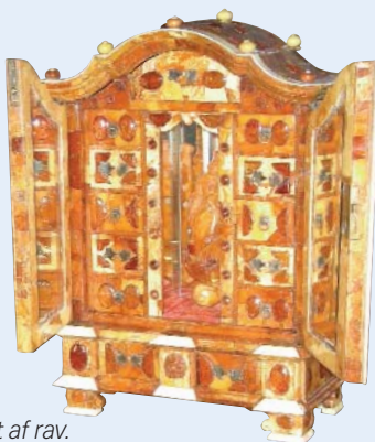
Lavet af rav.

Torsdag - Det er fridag, og da Inge insisterer på at ville se Ravmuseet, må vi igen en tur med bus/sporvogn til byen. Ravmuseet