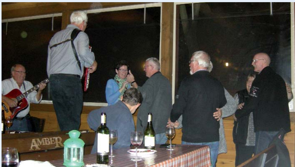
2297 Nu er PB-band varmet op

Mange af os bruger formiddagen på at være sociale og udveksle erfaringer fra turen. Et par hold havde været udsat for plattenslagere. Det ene hold betalte vistnok 50 for rådgivning om motorvejsafgiften i Polen. Det andet hold vil jeg betegne som klassiske DCK'er. De har et meget nært og personligt forhold til egne penge og er ikke til at vride mønt ud af. Som landskasserer ved jeg, hvad jeg taler om. De kørte bare fra opkræverne. Men der kan være noget om snakken om vejafgift, og det bør undersøges inden næste tur til Polen.