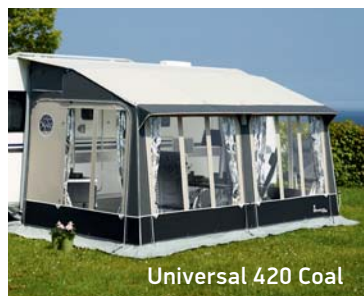
Universal 420 Coal

Læs mere på www.isabella.net eller i Isabellas nye katalog, der fås hos din campingforhandler.