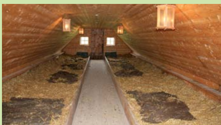
Soldater anno 1864 havde sikkert meget at klage over. Her kasernebygning med fælles-senge fyldt med halm i madrasserne.

Sønderborg er som skabt for besøg med autocamper eller campingvogn, og campingpladserne er mange og gode. Tager vi så med at byen har utallige små knejper, cafeer, spisesteder og småbutikker, skulle alt ligge til rette, for et meget vellykket nordisk campingtræf i 2015.