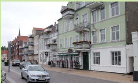
Sønderborg er en hyggelig, lille dansk by med i underkanten af 30.000 indbyggere.