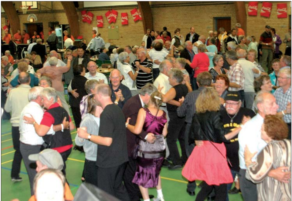
Festaftenen er altid et fest indslag.

Opmærksomheden henledes på, at Dansk Caravan Klub ikke kan gøres ansvarlig for skader på materiel eller personer, der måtte opstå i forbindelse med eller i tilknytning til deltagelse i et af klubben planlagt og afviklet arrangement.