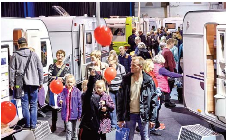
Camping er officiel partner på Ferie for Alle 2017.