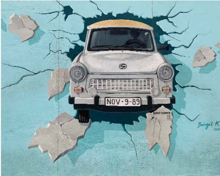
Et maleri fra den 1300 meter lange Berlinermur.

42 hvert år. Det er en folkefest, alle berlinerne er på gade, stemningen er i top. Lysten til at blive i byen og fyre den maksimalt af er til stede, med det er kræfterne ikke. Der var også en dag i morgen. Vi tog hjem, der var trods alt flere skift med undergrund og busser. Vi nåede at se den sidste bus der