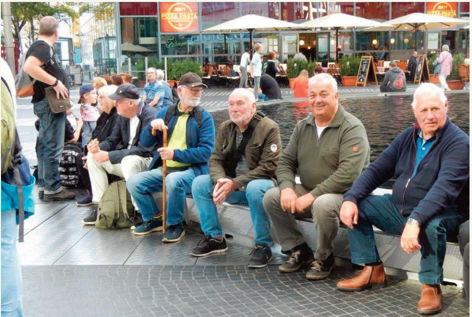
Klubbens gamle drenge

Historien om fængslet i Hohenschönhausen begyndte i juni 1945, da det sovjetiske hemmelige politi overtog bygningerne og gjorde dem til opbevarings og transit lejr. "Special Lager No. 3". Fængslet var ikke stort dengang. Cellerne lå i en fugtig kælder (også kaldet U-båden), og da fængslet var småt, måtte der være de flere i kældrene. Ofte så mange at man måtte skiftes til at ligge ned. Det var ikke noget sundt sted at være: Kondensvandet drev af væggene og skimmel-svamp alle steder, potten i hjørnet måtte