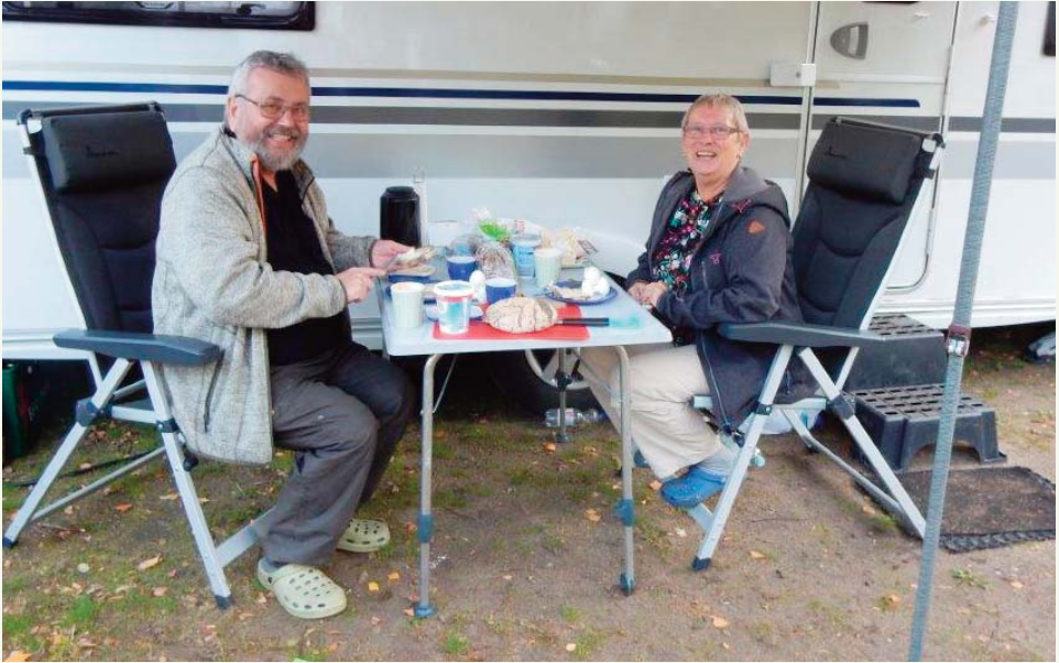
Vores fantastiske værter.