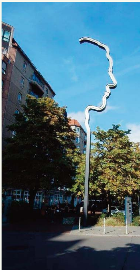
Ansigtprofil af Georg Elsetr, manden der prøvede at springe Hitler i luften, en novemberaften 1939.

Tusinder af politiske fanger har passeret gennem dette fængsel og snart sagt alle