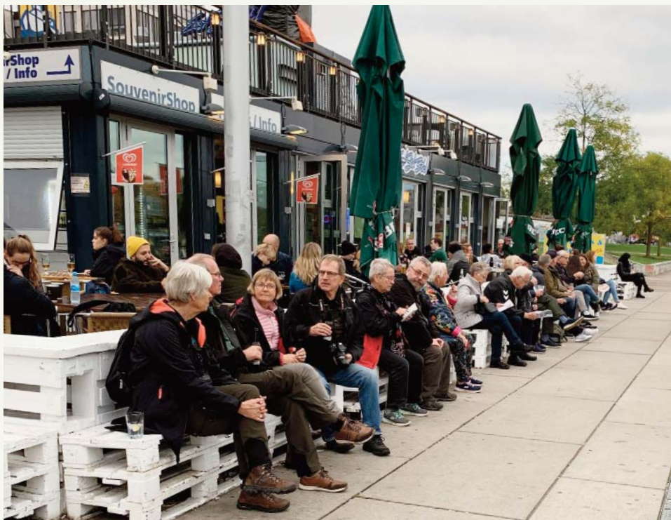
Drikkepause efter 1300 meter af forskellige kunstværker på Berlin muren.

Tiden gik og vi var blevet sultne, så hvad var mere nærliggende en at tage den nærliggende ikoniske "pølsevogn", pølsehus, der har ligget der siden 1930 og har overlevet DDR tiden og er kendt for sine gode currywurst. Det må være en god forretning, der er kø fra de åbner til de lukker året rundt.