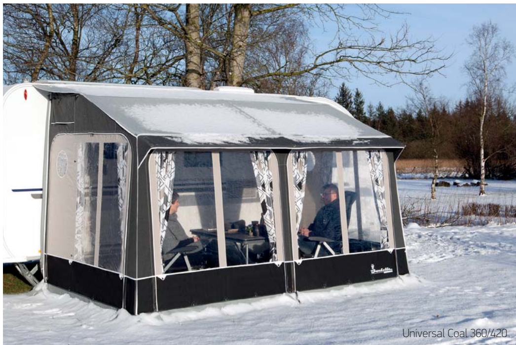
Universal Coal 360/420