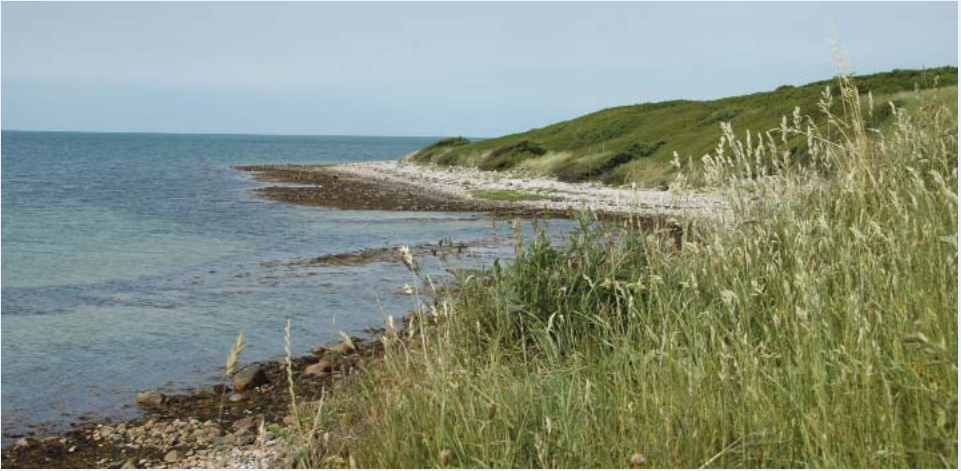
Området omkring Sejerøbugten indbyder til små udflugter.