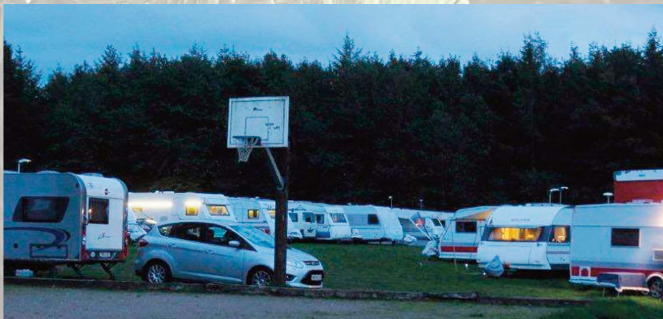
Ro over pladsen på DCK jubilæumsstævne 2918