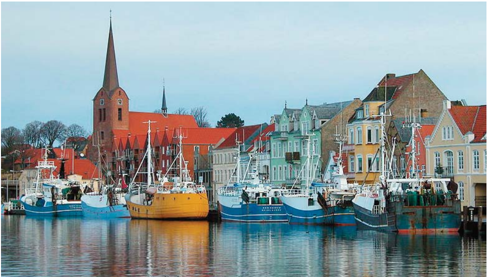
Sønderborg, havneidyl.