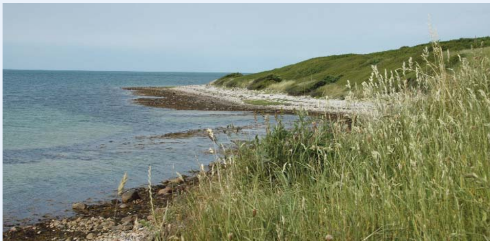
Området omkring Sejerøbugten indbyder til små udflugter.