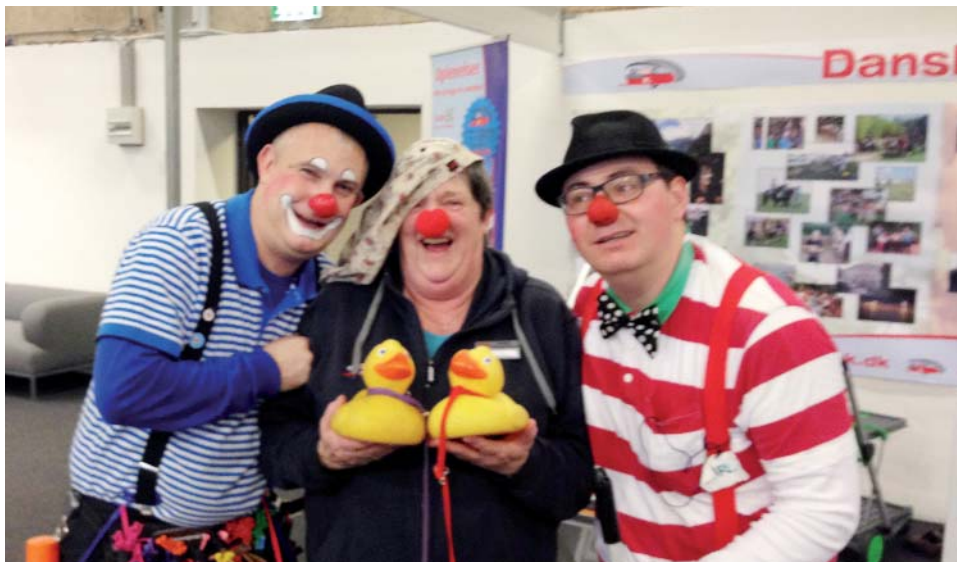
God stemning fra "ferie for alle" i Herning.

hilse på medlemmer, som man måske ikke ser i det daglige.