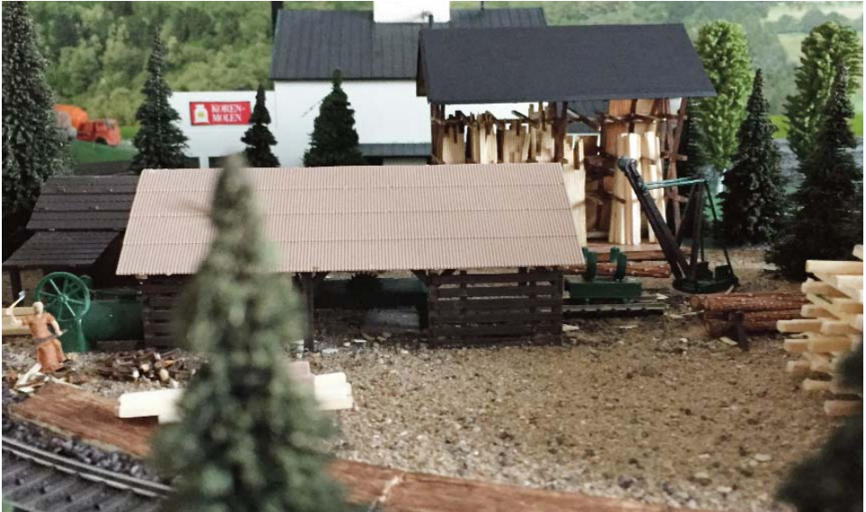
Antin hugger brænde til den damptrukne sav. - opbygning af egen bane.

Hej alle medlemmer af DCK. Her følger en kortere beskrivelse af årets påsketur.