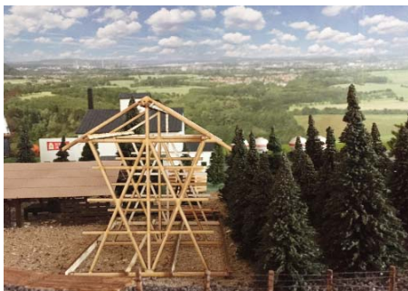
Den nye tømmerlade under opførelse.

via 50 computere. Der er brugt 750.000 arbejdstimer på opbygningen af anlægget og der er i dag 360 medarbejdere, der får det hele til at fungere. Samlet pris ca. 120 mio. kr.