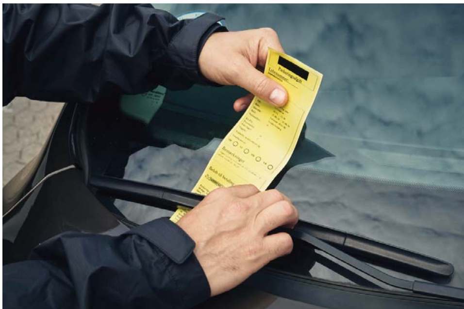
Det nye Parkeringsklagenævnet er blevet endelig godkendt af erhvervsminister Rasmus Jarlov. Dermed får forbrugere bedre mulighed for at få afgjort sager om private p-afgifter.

ringsklagenævnet kan gøre en positiv forskel – både for forbrugerne og branchen – og ikke mindst kan det aflaste domstolene for mange parkeringssager. FDM glæder sig til at komme i gang med nævnsarbejdet.”