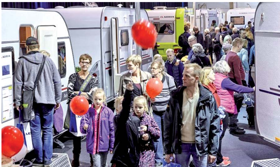
Foråret er startet smukt på campingområdet allerede, hvor familier i alle aldre besøgte udstillerne på Ferie for Alle.

Foråret er for længst startet i campingbranchen, der mærkede optimisme på Ferie for Alle i MCH Messecenter Herning. Det gælder både, når det kommer til nye campister og vintercamping.