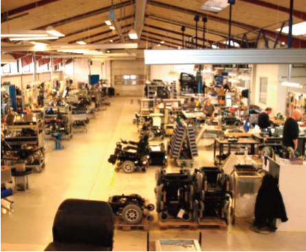
Medema hvor der laves el-scootere og handicapkøretøjer.

Kl. 18 mødes vi i teltet til medbragt mad og drikke. Ca. kl. 20 er der information for næste dag og happy hour.