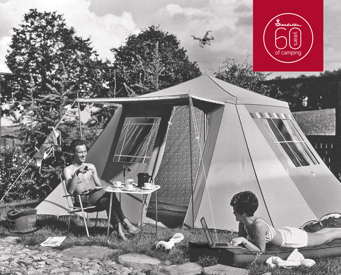
Isabella Eskimo Sport fra 1969