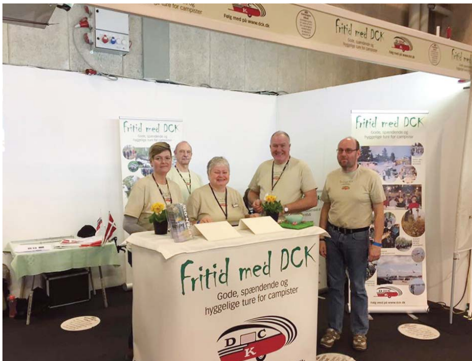
DCKs stand med frivillige, der hvervede en del nye medlemmer.

besøgstellene, men fredag og lørdag var der mange besøgende, søndag lidt færre, tror jeg. Hvis det samlede besøgstal i Herning var mindre end de foregående år, så tror jeg ikke, at det slog igennem på campingområdet, der forekom meget velbesøgt, og købelyst var der tilsyneladende.