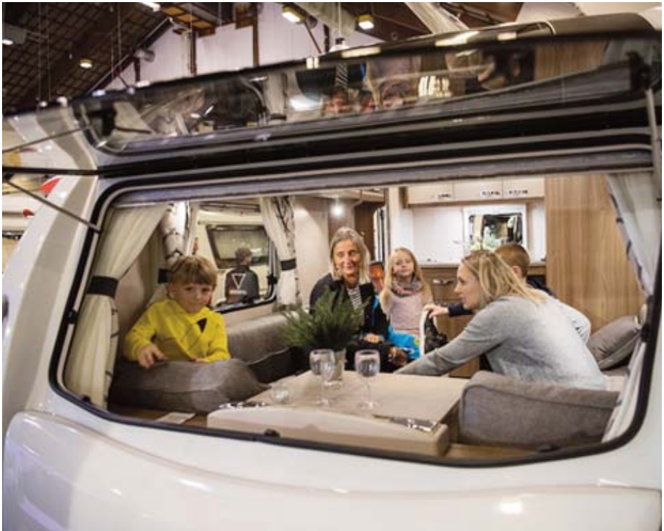
Camping var officiel partner på Ferie for Alle 2017.

- Vi takker udstillerne for at brag af en messeindsats samt de mange besøgende, fordi de kom forbi. At gå rundt på en messe med tilfredse udstillere, glade besøgende og masser af handel, det er et privilegie. Forretning opstår, hvor mennesker mødes, og det gør de i den grad på Ferie for Alle, siger projektchefen.