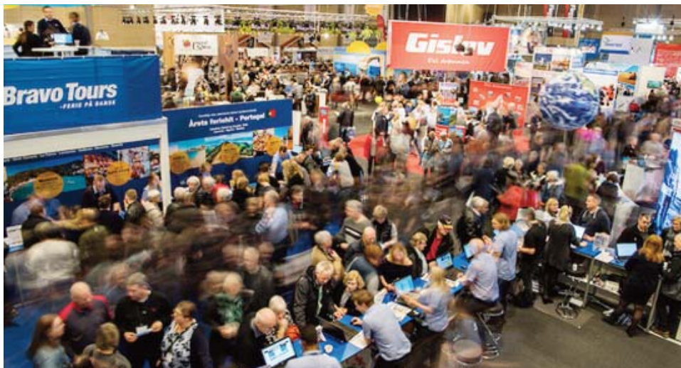
59.143 besøgende lagde vejen forbi Ferie for Alle 2017.

Den 20. udgave af Ferie for Alle sluttede i søndags i MCH Messecenter Herning. Rekordmange udstillere har de seneste tre dage præsenteret ferier, udstyr, aktiviteter og masser af inspiration.