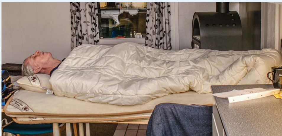
Sengetøjet med magneter afprøves.