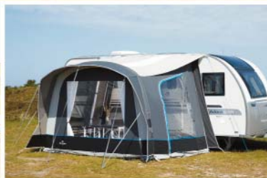
Isabella Ventura Air VIVO

Besøg din nærmeste campingforhandler og find det rigtige lufttelt til dig eller se mere på www.isabella.net