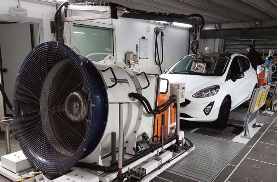
Green NCAP tester både bilens forbrug og udledning af skadelige stoffer. På sigt er det tanken at udvide testen, så den omfatter bilens samlede klima- og miljøaftryk, fra den produceres, til den skrottes.