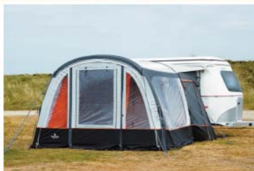
Isabella Ventura Air SIMPLEX