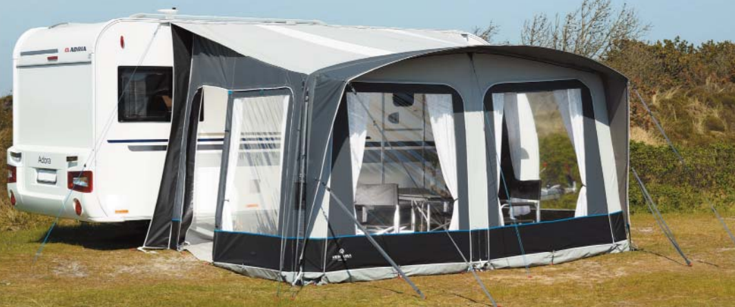
ISABELLA VENTURA AIR TRINUS

Som campist kan du tage lige derhen, hvor dit feriehjerte banker. Fra sted til sted ud i det blå. Og med et Ventura Air luftfortelt fra Isabella har du den ideelle rejsemakker på campingferien. Ventura Air luftteltene er lynhurtige at sætte op, så det er nemt at rejse til nye feriedestinationer.