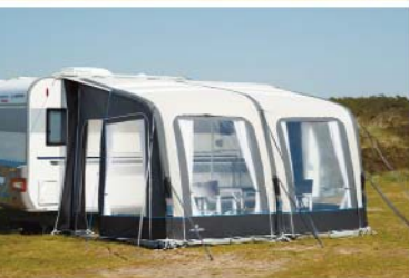
Isabella Ventura Air CITO