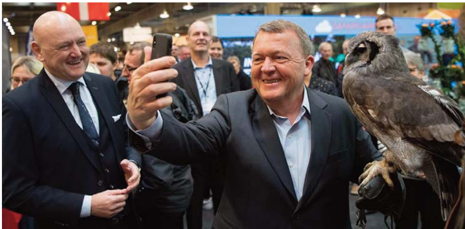
Statsminister Lars Løkke Rasmussen gæstede Ferie for Alle i selskab med 61.318 andre ferieglade danskere.

Ferie for Alle sluttede i MCH Messecenter Herning efter tre dage, hvor næsten hele verden var samlet i Herning til Skandinaviens største feriemesse, der bød på besøgsfremgang, netværk, oplevelser og gode handler.