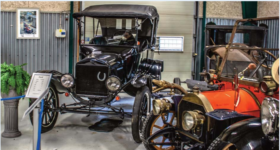
Vestsjællands Automobil Museum