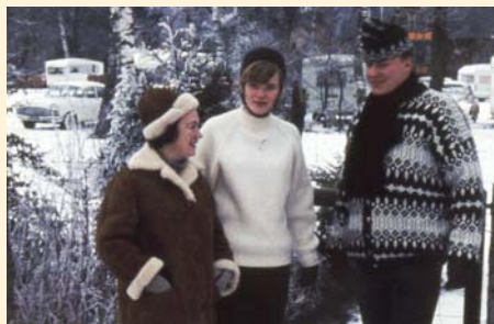
Gåtur rundt om pladsen på Gunnested Camping.

Klubbens første campingplads hed "GUNNESTED CAMPING" og ligger i Hvalsø på Sjælland. Det var bonden på Gunnestedgård