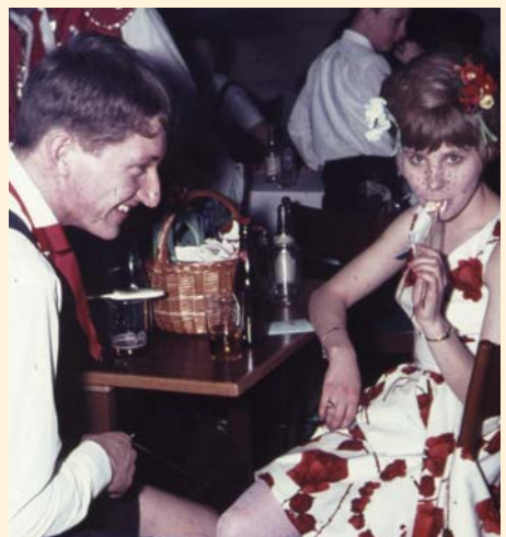
Karneval i Fredericia

Alt var repræsenteret. Tyroler, en ung mand havde stivet sin pyjamas i kartoffelmel så den var stiv som et jakkesæt og med stråhat lignede han en fra tyverne. Vores venner, manden var klædt ud som dame med paryk og sminke, konen som mand. Jeg kunne