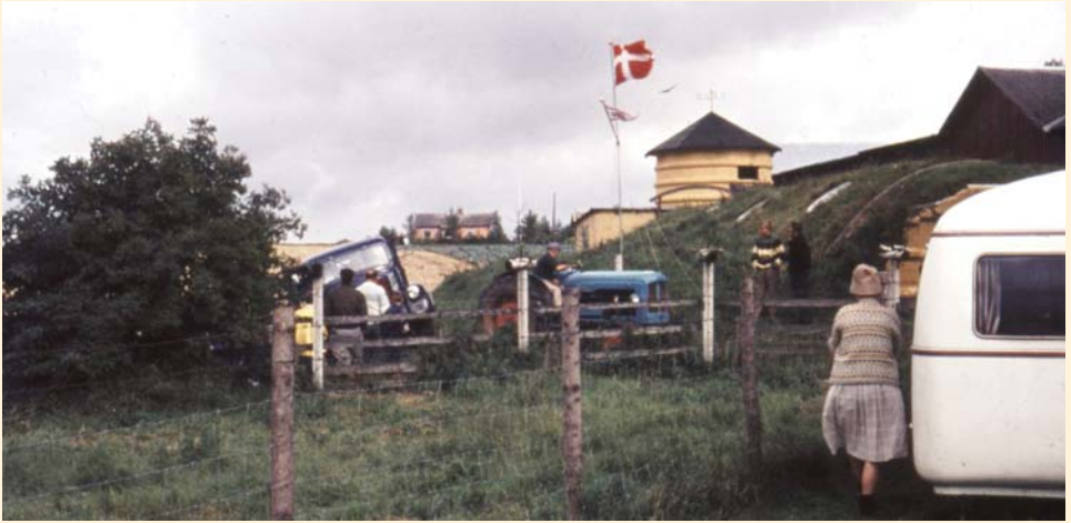
Roekulen på Gunnsted Camping

der var ejer af pladsen, men havde indrettet den til DCK. Pladsen ligger der stadig, men er nu en fastliggerplads. Der kom vi tit, sommer og vinter. Herfra kan berettes mange oplevelser, men jeg skal fatte mig i korthed. I forbindelse med pladsen lå der en muret roekule. Den fik vi indrettet til samlingsstue. Der var ikke megen plads, men lang, meget lang og lige så kold som den var lang. Vi fik indrettet en pejs i den modsatte ende af indgangen.