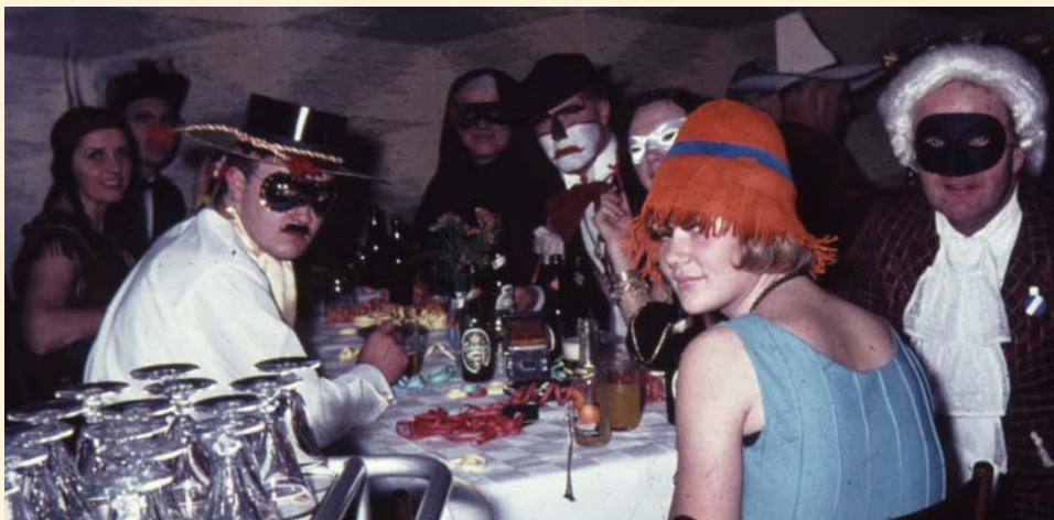
Karneval i Fredericia