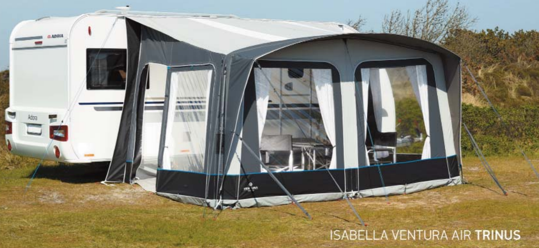
ISABELLA VENTURA AIR TRINUS

Som campist kan du tage lige derhen, hvor dit feriehjerte banker. Fra sted til sted ud i det blå. Og med et Ventura Air luftfortelt fra Isabella har du den ideelle rejsemakker på campingferien. Ventura Air luftteltene er lynhurtige at sætte op, så det er nemt at rejse til nye feriedestinationer.