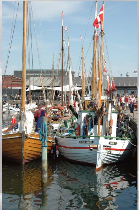
Ud over Træskibtræf i Holbæk, er der "Kunstdage i pinsen", hvor Kunstnere over hele Sjælland byder indenfor i atelier og værksteder.