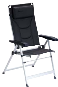
Isabella Odin Chair

Hent det nye 2016 Isabella katalog hos din forhandler eller se mere på Isabella.net .