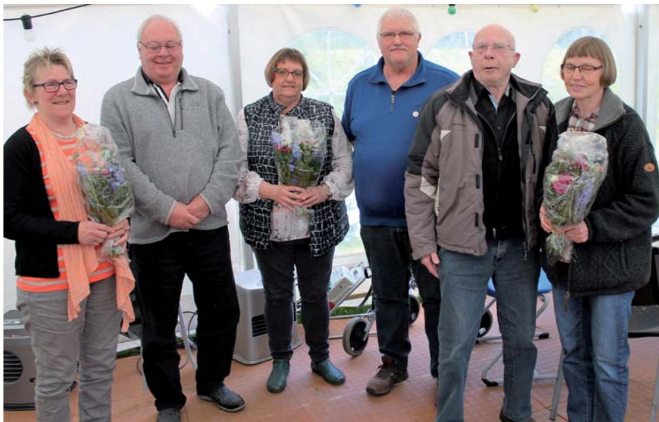
25 års Jubilarene.