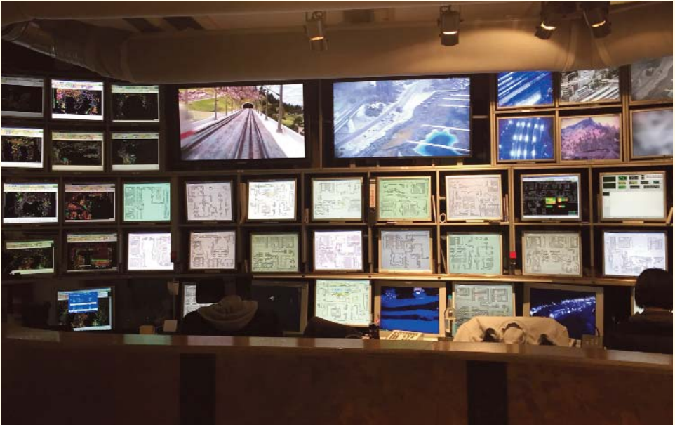
Lokalet, hvor 50 computere står for styringen af anlægget.