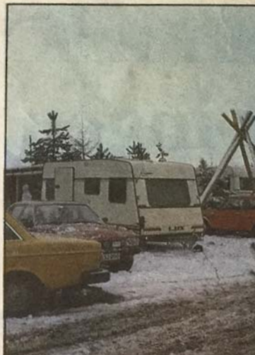
Sne og kulde afskrækker ikke de ægte camp