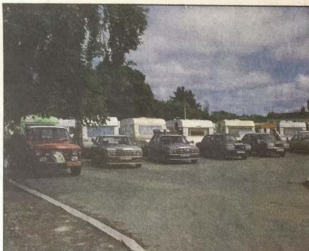
Camping-kliquen er klar til afgang