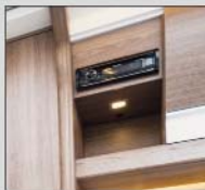
Radio med Bluetooth