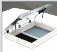
Heiki II De Luxe