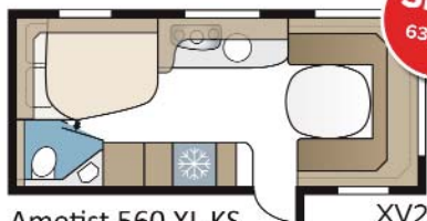
Ametist 560 XL KS