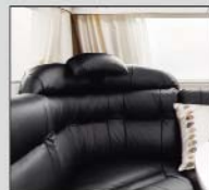
2 stk. nakkepuder