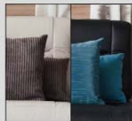
Skind: Halmstad / Onsaldo