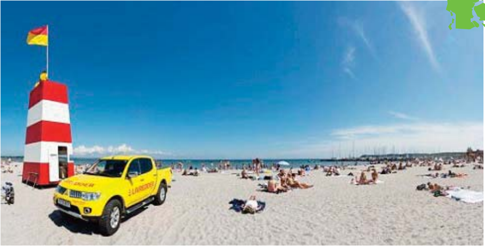
Kerteminde Nordstrand, som er Fyns bedste strand.