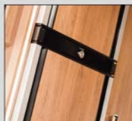
Stort 190 l køleskab (2 låger)