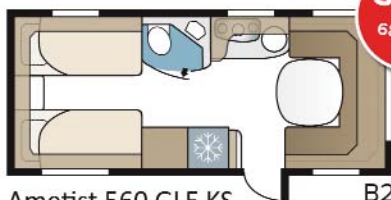
Ametist 560 GLE KS