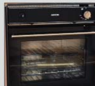
Ovn under køkkenbordet