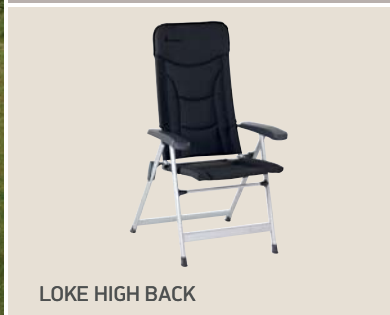
LOKE HIGH BACK