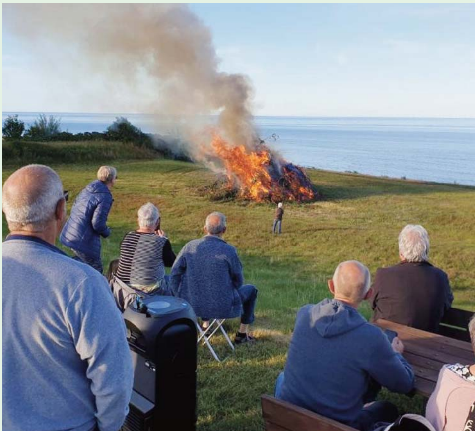
Bål med udsigt over stranden

I et efter jysk/fynsk forhold forrygende godt vejr, holdt Jylland/Fyn samling på Fornæs Camping i forbindelse med Skt. Hans – en i øvrigt tidligere meget brugt samarbejdsplads for DCK.