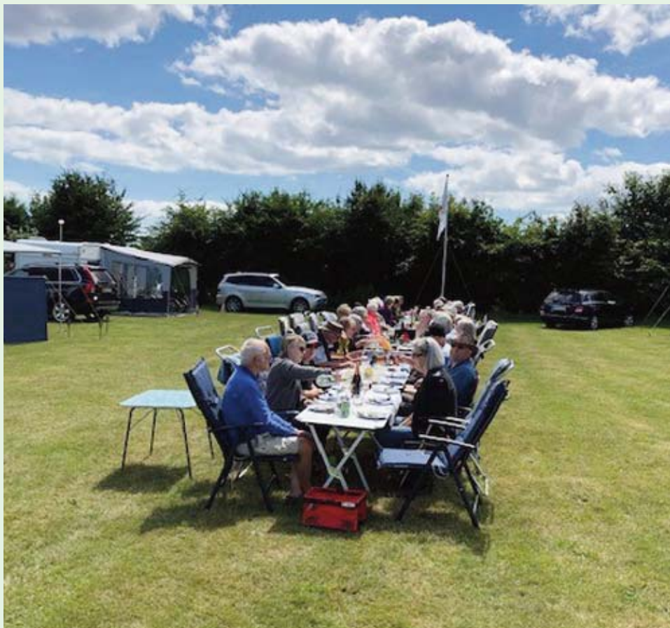
Middagshygge på Fornæs