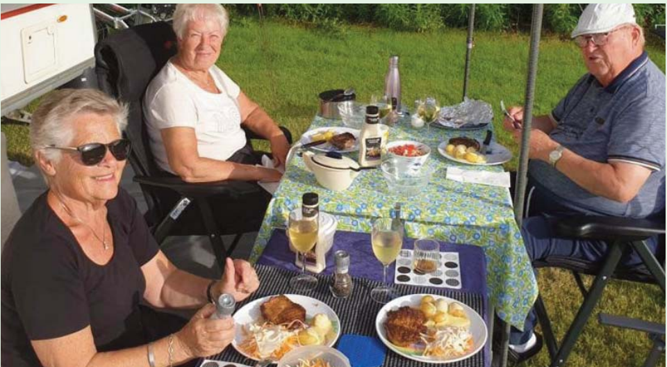
Så er der fiskefrikadeller til frokost

Sidst. men ikke mindst turistområdet Bønerup Strand m.m., hvor der var rig mulighed for indkøb af blandt andet store isvafler og diverse fiskespecialiteter m.m., hvilket der var ganske stort salg i til deltagerne fra Fornæs Camping. →