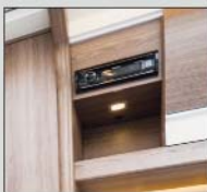
Radio med Bluetooth