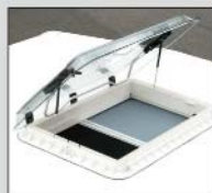
Heiki II De Luxe