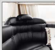
2 stk. nakkepuder