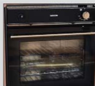
Ovn under køkkenbordet