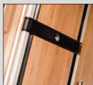
Stort 190 l køleskab (2 låger)