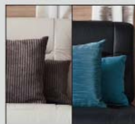
Skind: Holmstad / Onsala