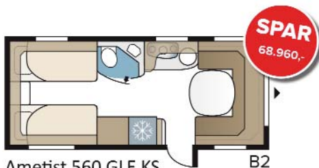
Ametist 560 GLE KS B2

Kørekklar vægt ca. 1.690 kg Totalvægt 2.000 kg