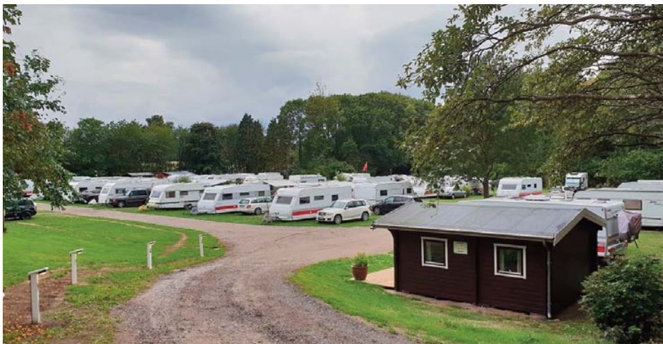
Billedet er Skamstrup vores dejlige klub campingplads. Billedet er fra weekenden ved 60 års jubilæet. Man kan sige at pladsen var rigtig godt besøgt. Det siger så meget at DCK er en klub for alle små og store familier. Der kommer flere og flere familier med børn hvilket jo er rigtig positivt for en gammel klub at der fortsat kommer mange nye medlemmer ind i alle aldre. Pia DCK 2090 - Foto: Susanne Røssel.

ændringer i organisationen. Du kan som sædvanligt se dagsorden og referat af mødet på hjemmesiden, når mødet er afviklet.