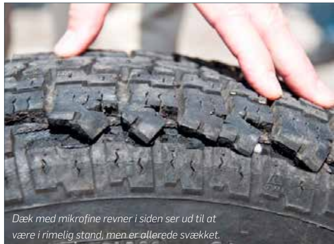
Dæk med mikrofne revner i siden ser ud til at være i rimelig stand, men er allerede svækket.