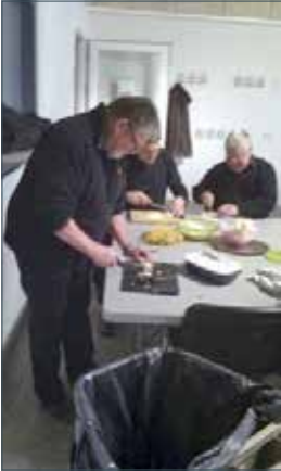
Der arbejdes på at gøre grøntsagerne klar.