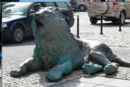
Billeder af løver man kan møde på et torv, de er fredelige og til at sidde på.