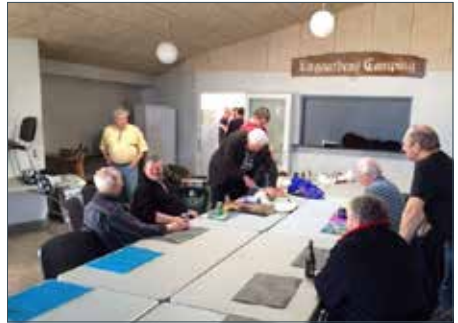
Der er nogle, som er i særdeles god tid med borddækningen...

Så kom grandprixen. Som jeg hørte på vandrørerne, var der nogen som natten i forvejen havde stjålet fjernsynet i fællesrummet, men der var åbenbart ingen nåde – campingpladsen havde indkøbt et nyt.