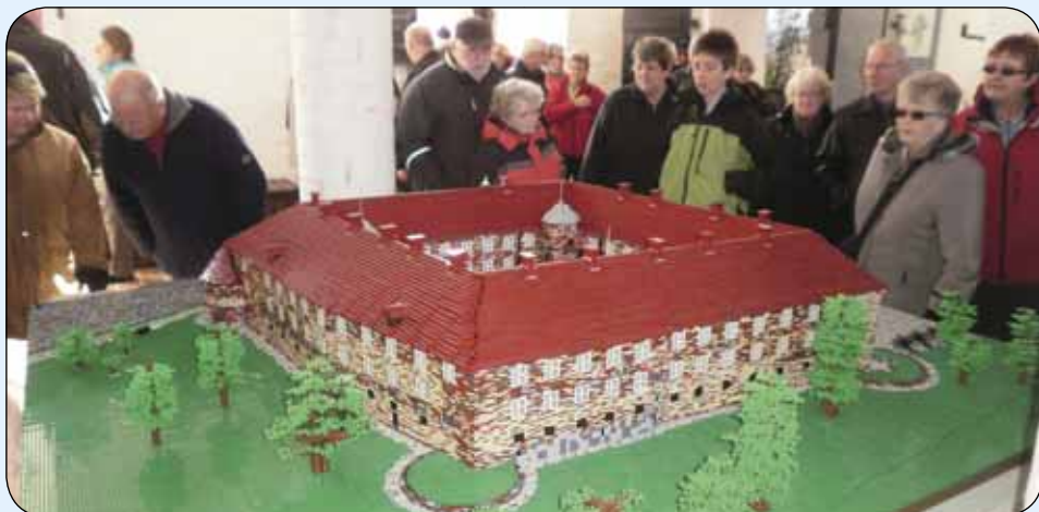
Model af Sønderborg Slot i Lego.

mad, det var billigt, og det var mere end rigeligt, ja vi delte faktisk det sidste, så vi hver især havde noget til næste dag.