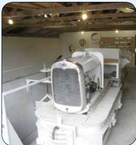
Indgang til Catrinesminde Teglværket.

mad, det var billigt, og det var mere end rigeligt, ja vi delte faktisk det sidste, så vi hver især havde noget til næste dag.