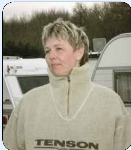
Lejrchefen på Spar Es Camping.