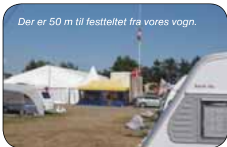
Der er 50 m til festteltet fra vores vogn.

Søndag stod vi så tidligt op og kørte til Tomelilla, hvor der var indkøring fra kl. 8 og vi var der ca. 8:30. Vi fik vores plads og fik sat vores markise op med telt om, satte os i skyggen og iagttog alle de mange vogne, der kørte ind på