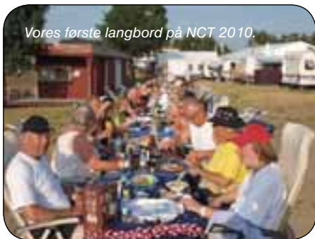
Vores første langbord på NCT 2010.

Der var masser af tid til at være turister i området, som virker meget dansk! Naturen, byggestilen og haverne virkede meget bekendte. Også byerne med de gamle byhuse med hyggelige baggårde, bindingsværkshuse og smalle stræder, er tydeligt præget af, at have været dansk. Der var et fantastisk 50'er museum, med mange genstande vi kunne genkende. Vi var også på en kalkunfarm, hvor der var et gårdudsalg. Ja, men det var større end mange store slagterbutikker herhjemme!! Seks til at ekspedere og en lind strøm af kunder!