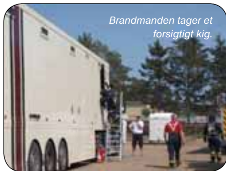
Brandmanden tager et forsigtigt kig.

Pludselig så vi nogen der løb med en ildslukker og kort efter hørtes udrykningskøretøjer. Det viste sig, at der var ild i den store lastbil fra cateringfirmaet, der lige havde bakt ned ad vores gade, inden den parkerede