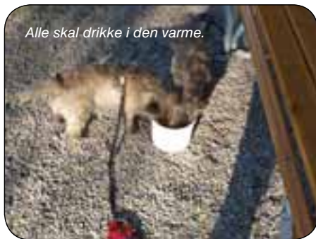
Alle skal drikke i den varme.

Sådan en uge får selvfølgelig en ende, og fredag var der så den officielle afslutning ( den uofficielle tog vi i kvarterene ved langborde ). Her blev der igen holdt taler, med tak til dem som havde arrangeret det hele og overrakt små standarder til de rette personer. Det hele blev dog brat afbrudt, fordi der var en svensk