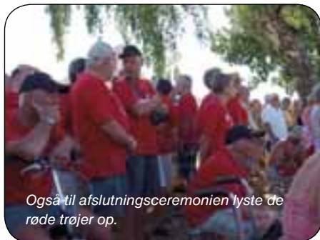
Også til afslutningsceremonien lyste de røde trøjer op.