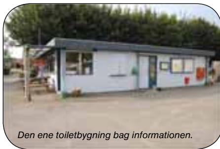
Den ene toiletbygning bag informationen.

Toilet og bad var ikke det helt topmoderne, men helt i orden rent og pænt, faktisk lidt charmerende retro.