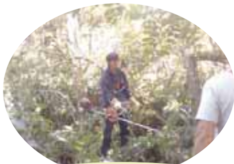
Der ryddes stier i skoven

Udendørspladsen til opvask ( lige ved indgangen til køkkenet ) er blevet gjort færdig og fungerer nu fuldt optimalt med varmt vand og afløb. 😊 Håber I vil tage godt imod den og bruge den i stedet for at gå ind i køkkenet.