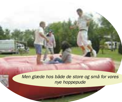
Men glæde hos både de store og små for vores nye hoppepude

Der arbejdes kraftigt på at få ryddet stier i skoven for at skabe rammer om hyggelige gåture, en gang kondibingo i ny og næ, og hvad man ellers har lyst til. Det er et større arbejde, som skrider frem stille og roligt.