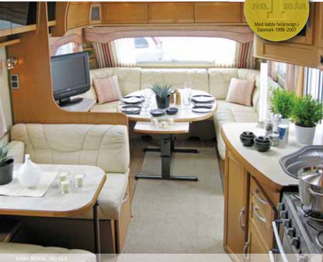
KABE ROYAL 780 GLE